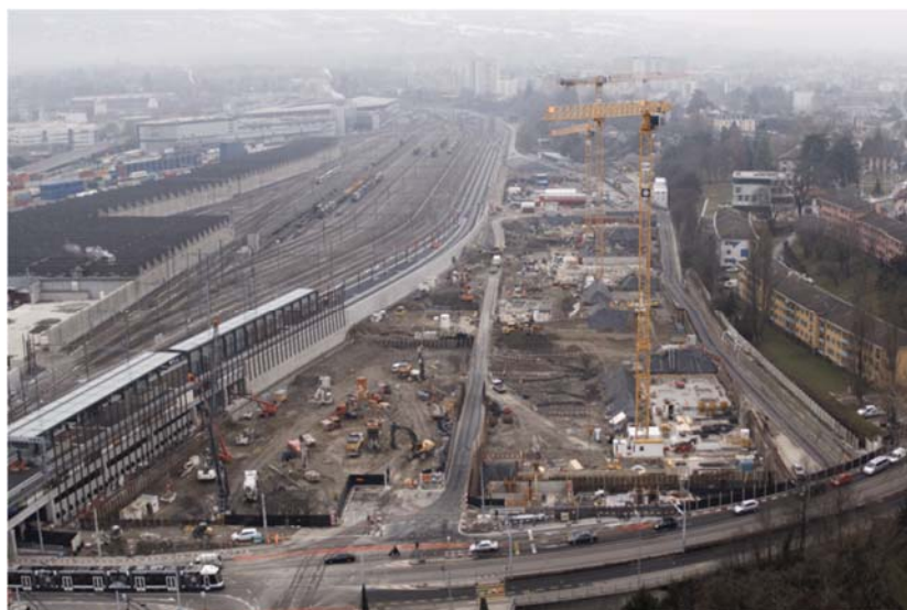
Quartier de l'Adret Pont-Rouge, Lancy, vue depuis le sud du site, lots A et lots B+C en chantier, décembre 2017