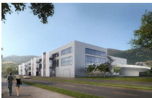
Bâtiment industriel modulaire, Itten+Brechbühl SA, 2016

Intégration des demandes et remarques des préavis des services spécialisés d'avril 2016.