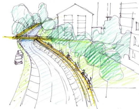
Projet de liaison (cheminement piéton)

Un projet général d'aménagement d'un cheminement le long de la Paudèze a été établi. Ce projet de liaison s'inscrit comme un élément structurant de l'aménagement urbain le long du cours d'eau, associant une volonté conjointe des deux communes de remettre en valeur cet élément naturel dans le patrimoine construit. Les mesures de sécurisation contre les crues ont également été identifiées et intégrées.