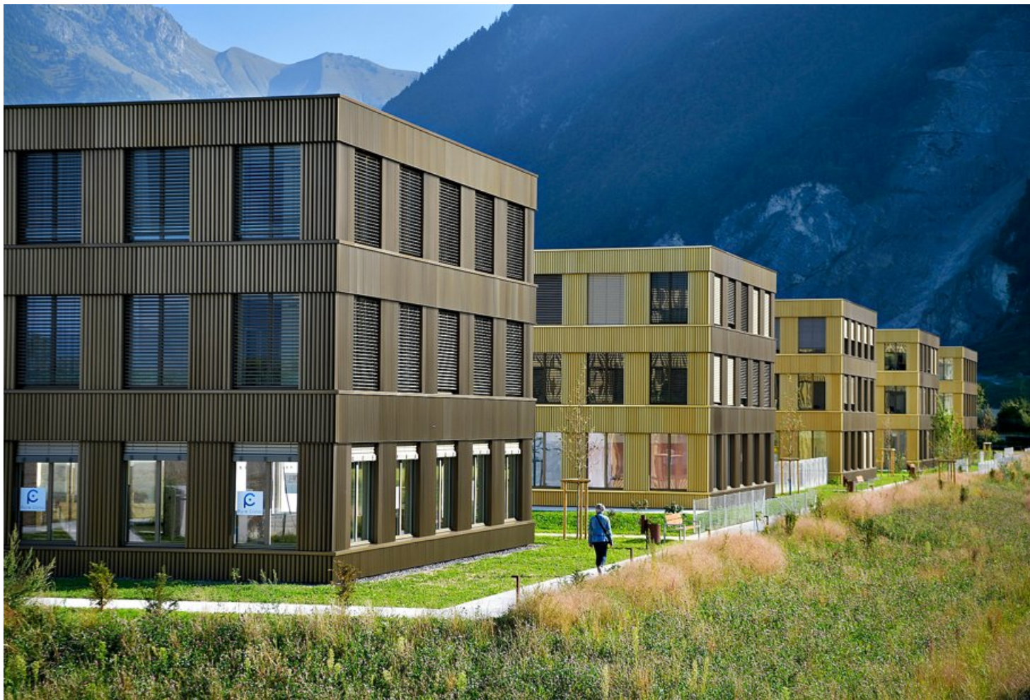
L'Espace Santé Rennaz s'étend sur 13 000 m 2 , répartis sur trois niveaux. Il a coûté 48 millions de francs d'argent privé.

Partenaire depuis le début, prescripteur, propriétaire d'une